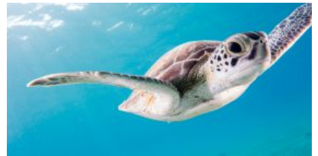
Strage di tartarughe marine per il freddo a Cape C