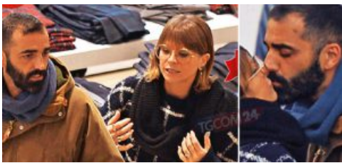
Alessandra Amoroso: regali di Natale a Roma e poi... il "sì"