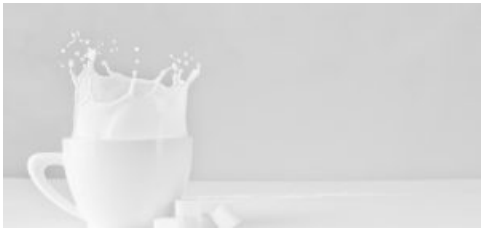
Latte, yogurt e formaggi proteggono il cuore. Lo dice la scienza