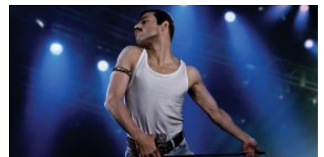
"Bohemian Rhapsody", film da record