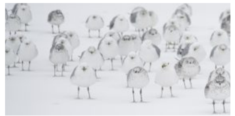
Inverno: gli accorgimenti per il confort dei volatili