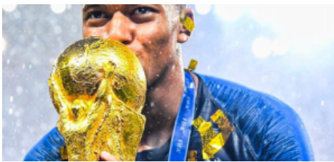
Mondiali e pastiera napoletana, le ricerche degli italiani nel 2018