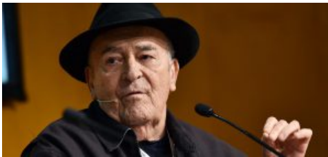
Mondo del cinema in lutto, è morto Bernardo Bertolucci