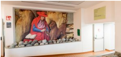
Bergamo, l'arte sbarca in corsia