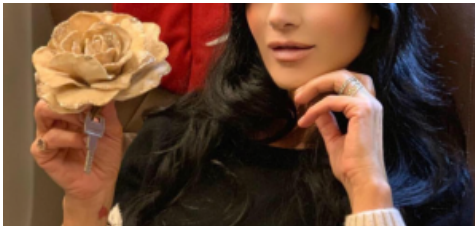
L'amore non ha età ... la storia di Pamela Prati