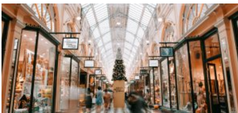
Natale: i doni più gettonati? Prodotti con una storia da raccontare sulle tavole