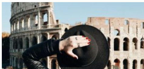
Il Colosseo, l'attrazione più amata la mondo