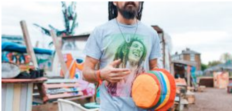
Unesco: la musica reggae è patrimonio dell'umanità