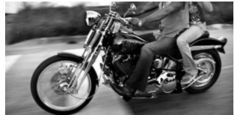
Zoe compie 30 anni e papà Lenny Kravitz 'si scioglie' via social