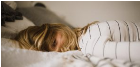
Chi dorme poco di notte si arrabbia di più di giorno.