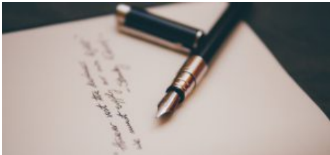
Albert Einstein: lettera su esistenza Dio battuta all'asta per oltre 2 mln di dollari