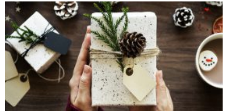
Natale 2018, gli italiani scelgono la cultura . . .