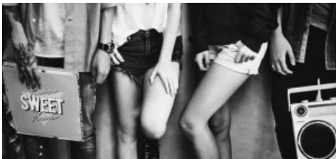
Giovani tra tradimenti, porno, bondage e no contraccettivi. Rapporto Eurispes